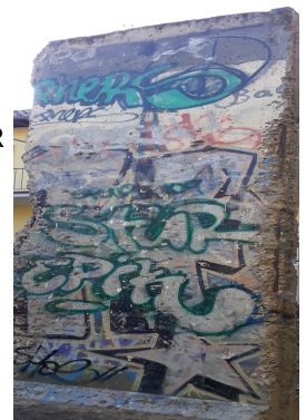
Original - Mauerrest