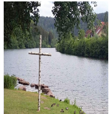
Vorsperre der Nagoldtalsperre

Fahrt: In Fahrgemeinschaften (8,00 Euro Kostenbeteiligung für Mitfahrer)