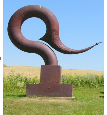
moderne Skulptur von L.A.